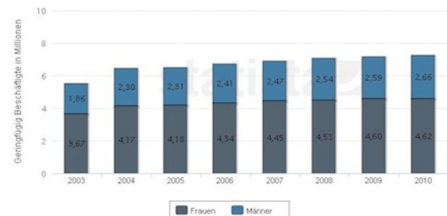
Geringfügig Beschäftigte in Deutschland von 2003 bis 2010 nach Geschlecht (in Millionen; Stand jeweils 30. Juni)