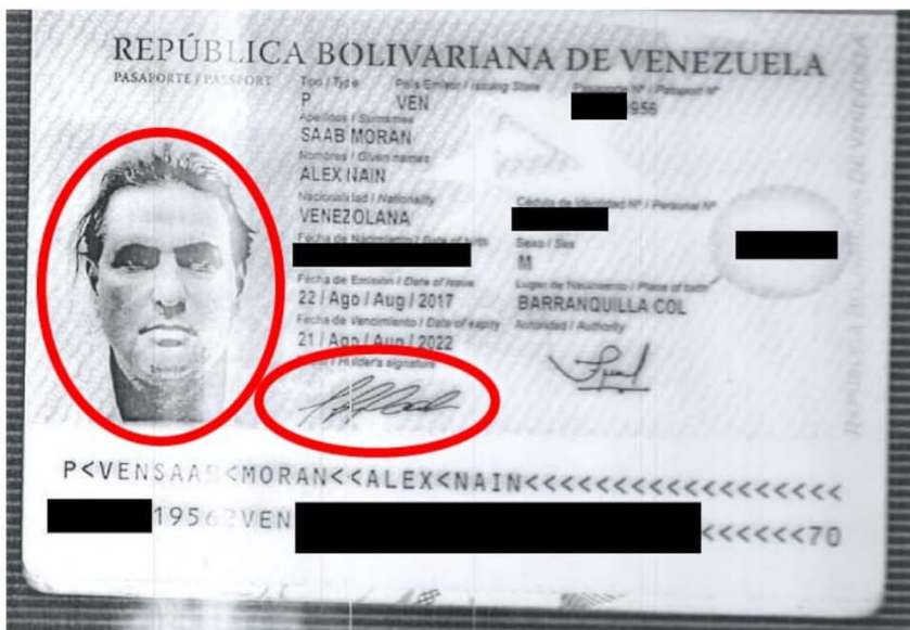
Venezuelan regular passport issued Aug. 22, 2017

Wenn die Nutzung von bereits vorliegenden Passfotos für mehrere Zwecke ein wirklich gewichtiger Hinweis auf „Fälschung“ wäre, dann hätten vermutlich auch viele Bürger in der Bundesrepublik ein Problem. Es wird zahlreiche Fälle geben, in denen zum Beispiel im Jahr 2018 gemachte Passfotos sowohl für den Reisepass, als dann auch ein, zwei Jahre später für den zu erneuernden Personalausweis genutzt wurden.