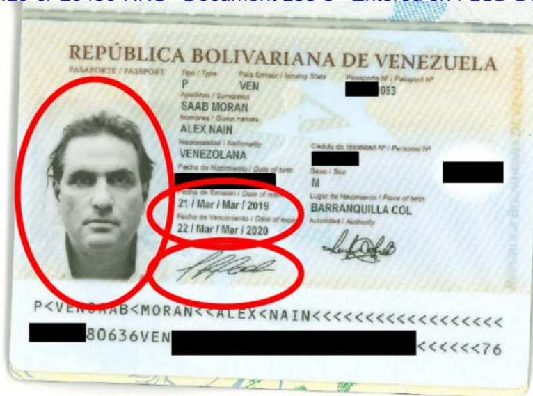
Venezuelan diplomatic passport issued 3/21/2019

Case 1:19-cr-20450-RNS Document 153-3 Entered on FLSD Docket 11/07/2022 Page 4 of 4