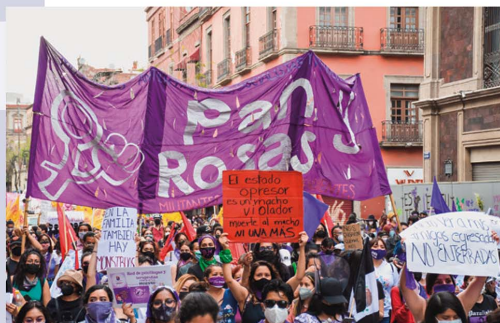
Feminismen und Geschlechterpolitik in Mexiko: ¡Ni una menos!