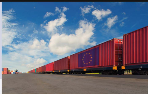
Eine Europäische Seidenstraße