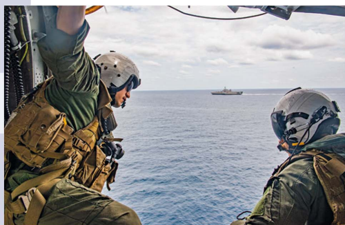
US Kriegsvorbereitung im Indopazifik?