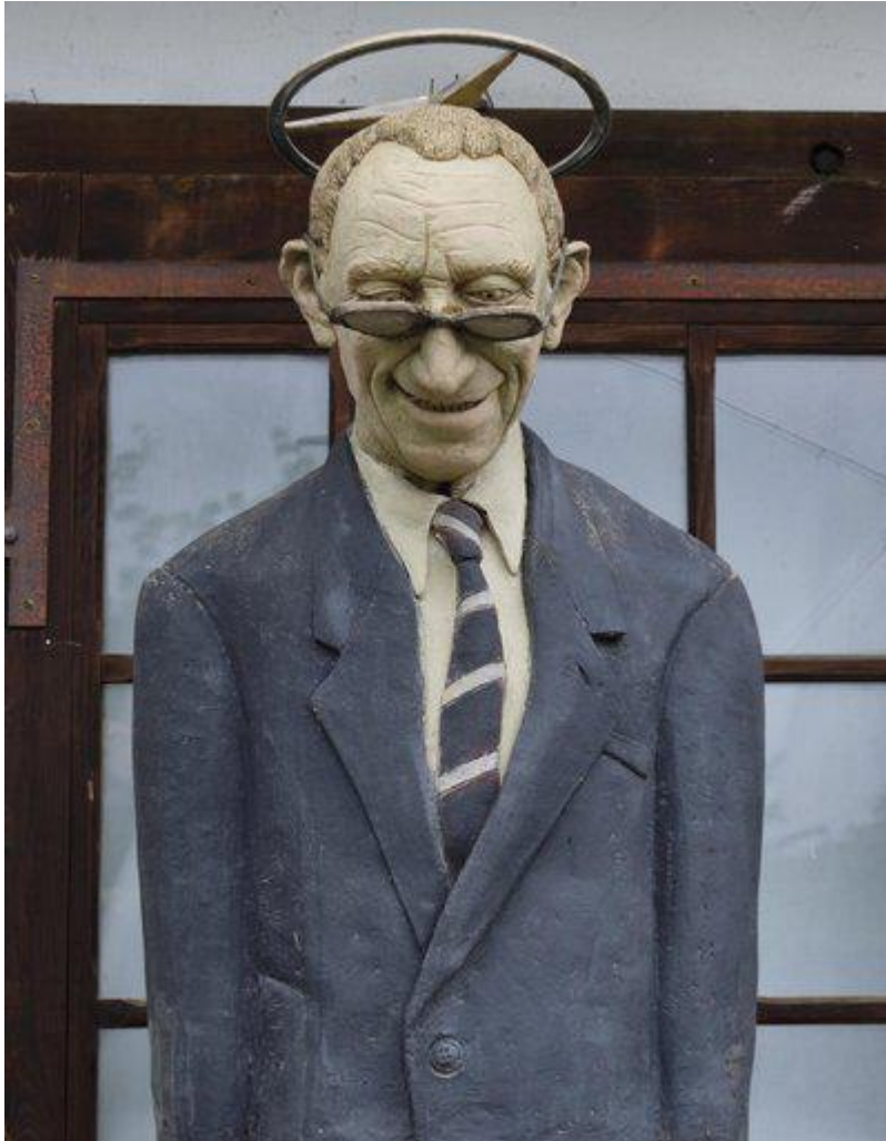
Peter Lenks Edzard-Reuter-Interpretation.