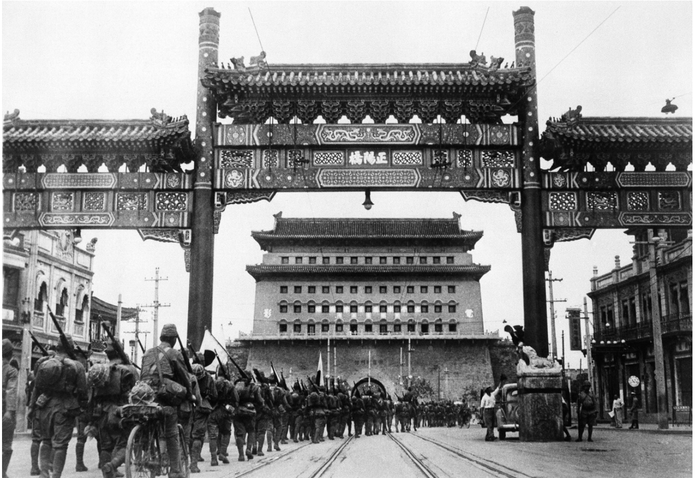
Japanische Truppen marschieren 1937 in Peking ein

In vier programmatischen Leitlinien beschloss die japanische Regierung, das Land fortan in die Lage zu versetzen, zur unangefochtenen hegemonialen Macht in Asien aufzusteigen – qua Stärkung der Schwer- und Rüstungsindustrie; durch die Integration der Mandschurei in die japanische Kriegswirtschaft; durch eine »harte Position« beziehungsweise die kompromisslose Durchsetzung japanischer Interessen auf dem asiatischen Kontinent und schließlich mit der Sicherung strategischer Rohmaterialien, um das Land autark zu machen. Die zur Selbstversorgung benötigten Ressourcen waren hauptsächlich im insularen und kontinentalen Südostasien – vorrangig Ostindien (Indonesien) und Malaya sowie in Indochina – zu finden.