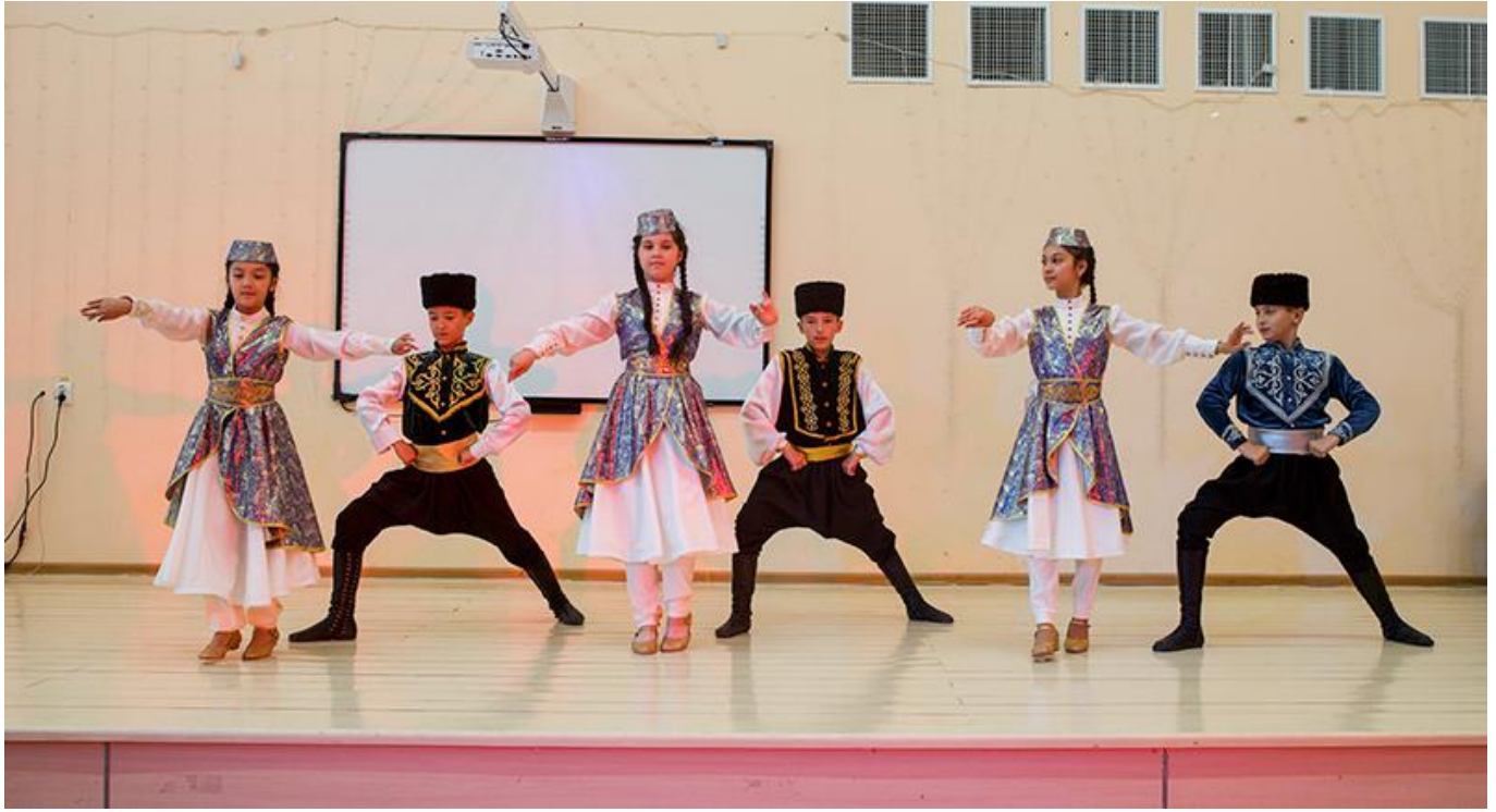
Zum Bild: Eine gelungene Überraschung für die Gäste aus der Schweiz: Tatarische Kinder führen verschiedene traditionelle Tänze auf.

Es waren zwei hochinteressante Stunden zusammen mit der Direktorin und weiteren Leuten aus dem Lehrpersonal an dieser neuen Schule. Was uns dann aber auch noch ans Herz ging, war eine offensichtlich ausserordentlich kurzfristig für uns organisierte Überraschung. Im Theater-Saal der Schule - ja, auch den gibt es - führten drei Knaben und drei Mädchen in traditionell-tatarischen Trachten und zu traditionell-tatarischer Musik ein gutes Dutzend Tänze auf - mit sichtbarem Vergnügen, aber auch mit etwas Stolz, wie uns schien. Und natürlich sah man die Freude in ihren Gesichtern und ihre leuchtenden Augen, als sie unseren - ehrlichen - Applaus sahen. Man hat ihnen sicher gesagt, sie hätten vor «hohen Gästen» aus der Schweiz zu tanzen - und wir unsererseits kamen uns auch tatsächlich vor wie «hohe Gäste», mit einer so wunderbaren Vorstellung überrascht zu werden.