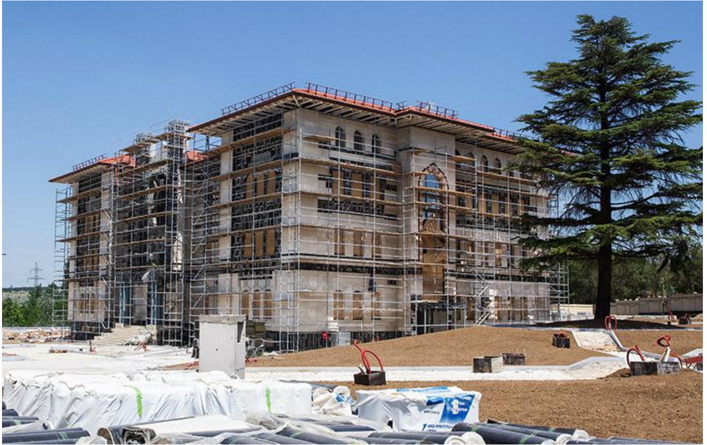
Zum Bild: Das gleichzeitig gebaute Kongresszentrum auf dem fast vier Hektar grossen Baugelände der Moschee. Hier soll die Administration mit etlichen Büros untergebracht werden. Das mehrstöckige Gebäude wird aber auch Sitzungszimmer und Konferenzsäle enthalten.