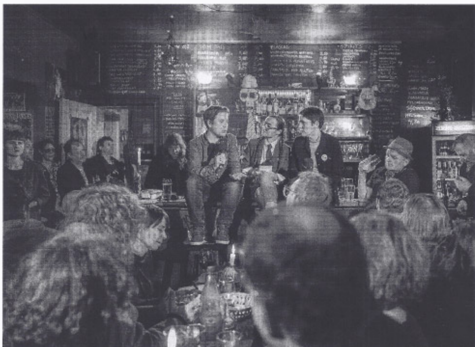
Juso Kühnert bei Kneipentalk: Ihm sind Kompromisse fremd