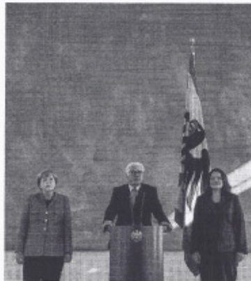
Merkel, Steinmeier, Nahles 2017

Die Rolle des Bundespräsidenten wird sich insgesamt verändern, er wird wohl häufiger schwierige Regierungsbildungen betreuen müssen. Schwache Volksparteien, Unvereinbarkeiten mit der AfD oder den Linken machen es komplizierter, Koalitionen zu finden. Eine Lehre für diese neuen Zeiten gibt es nun schon. Die Leitidee, die das Grundgesetz für den Präsidenten vorgesehen hat, bleibt die richtige: Zurückhaltung. Dirk Kurbjuweit