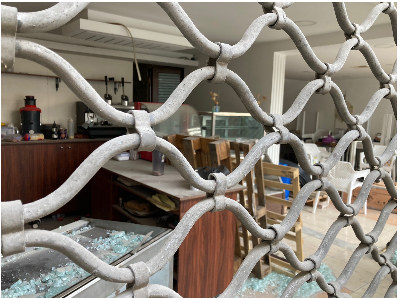
Ende eines Familienprojekts. Der Innenraum des Café Kayan ist mit Glassplittern übersät.