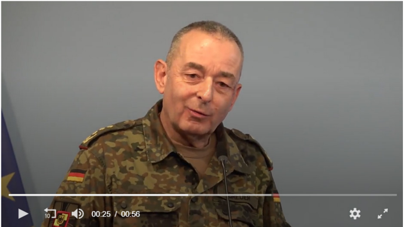
Pistorius verärgert über Wehretat - Kühnert rät zu Atempause

Kaum gibt es eine Einigung im Haushaltsstreit, da entbrennt die Debatte über Nachbesserungen. Der Verteidigungsminister macht seinem Unmut Luft. Der SPD-Generalsekretär hingegen träumt von Ruhe.