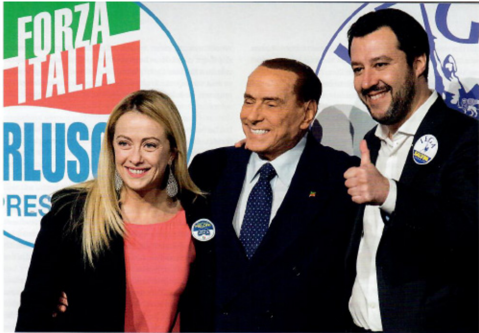
Das Triumvirat des Grauens: Giorgia Meloni, Silvio Berlusconi und Matteo Salvini (Rom, 1. März 2018)

Armen nimmt und den Reichen gibt. Ihr gesamtes Regierungsprogramm enthält denn auch alle wesentlichen Forderungen der einstigen P2-Loge, der Berlusconi ja angehörte. Das war jener Geheimbund des rechten Establishments Italiens, der über Jahrzehnte bis in die 80er Jahre verdeckt agierte mit seinem autoritären Programm, zu dem die schon seit langem angestrebte Umwandlung der parlamentarischen in eine präsidentiale Republik gehörte mit weitreichendem Verlust demokratischer Kontrollen. Eine daraus folgende Stärkung der Exekutive zu Lasten der Legislative soll jene „governance der Eliten“ befördern, die erstmals 1975 von der „Trilateralen Kommission“ zur Begrenzung eines vermeintlichen „Exzesses an Demokratie“ in den westlichen Staaten gefordert wurde. Um diesen fortschreitenden Demokratie-Abbau geht es auch in Zukunft. Die erste parlamentarische Maßnahme im neuen Jahr zielt auf die Verabschiedung des schon lange von der Lega vorbereiteten Gesetzes zur Schaffung der „autonomia differenziata“ der Regionen Italiens, ein komplexes Vorhaben für deren größere finanzielle Autonomie, das von der Opposition als fataler erster Schritt zur Spaltung und Auflösung des Nationalstaates angesehen wird. Sie will als ultima ratio versuchen, das mit einem Volksentscheid zu verhindern, ein schwieriges Unterfangen.