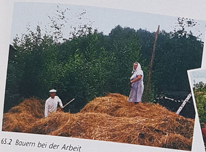
65.2 Bauern bei der Arbeit