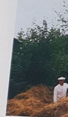
65.2 Bauern bei der