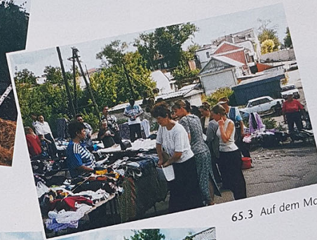
65.3 Auf dem Markt