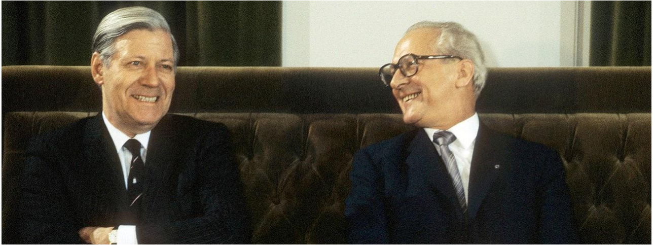
Bundeskanzler Helmut Schmidt sitzt neben Erich Honecker auf einem Sofa.

Deutlich erkennbar: Kalter Krieg! Die heute laufende Debatte über die Terminierung des Endes des Kalten Krieges auf 1989 reizt zum Sarkasmus.