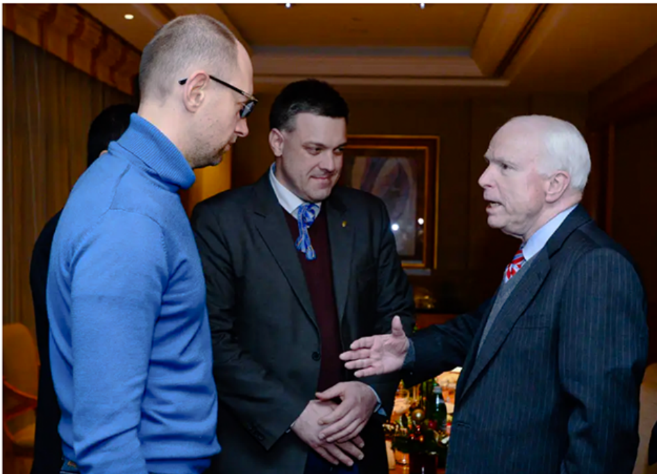
U.S. Senator John McCain, right, meets Ukrainian opposition leaders Arseniy Yatsenyuk, left, and Oleh Tyahnybok in Kiev, Ukraine, Saturday, Dec. 14, 2013.

Zum Bild: Am 14. Dezember 2013 unterhielt sich der US-Senator John McCain in Kiev mit den beiden ukrainischen Politikern Arsenij Jazenjuk (im Bild links) und Oleh Tjahnybok (Bildmitte), dem Führer der rechtsradikal-nationalistischen Partei Swoboda. Zwei Tage später, am 16. Dezember 2013, hielt McCain auf der Tribüne auf dem Maidan in Kiev eine Rede und versicherte den Demonstranten «Die USA sind mit Euch». Zwei Monate später, am 22. Februar 2014, wurde der rechtmässig gewählte Präsident Wiktor Janukowytsch weggeputscht und Jazenjuk wurde neuer Ministerpräsident.