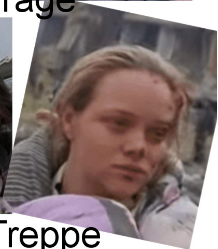
Frau auf Treppe