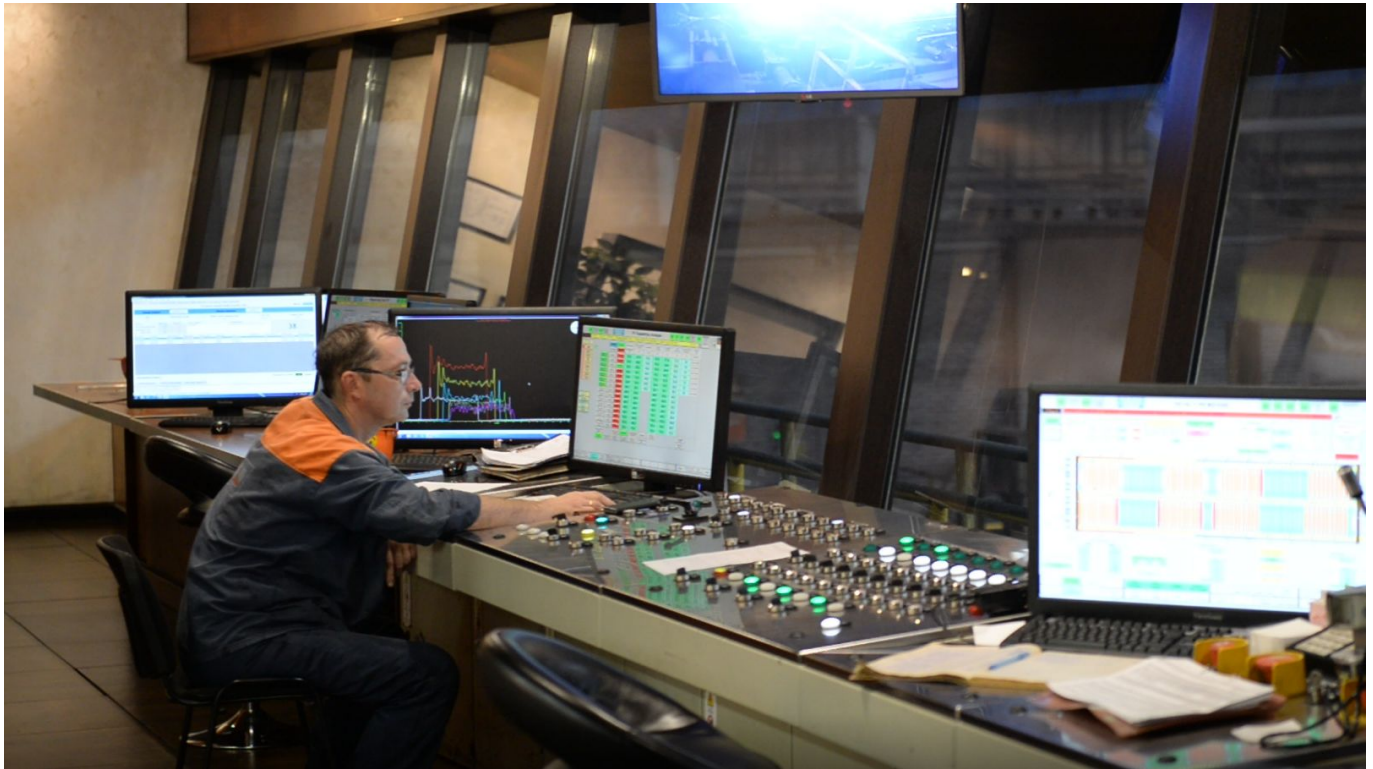
Leitzentrale des Röhrenwalzwerkes