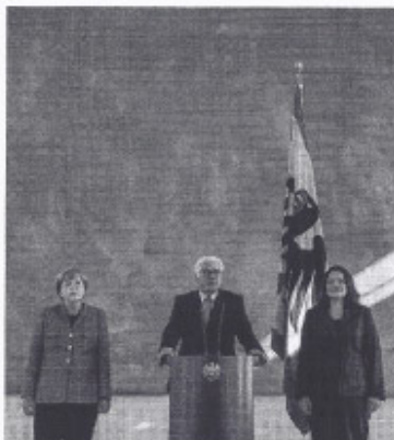
Merkel, Steinmeier, Nahles 2017

Die Rolle des Bundespräsidenten wird sich insgesamt verändern, er wird wohl häufiger schwierige Regierungsbildungen betreuen müssen. Schwache Volksparteien, Unvereinbarkeiten mit der AfD oder den Linken machen es komplizierter, Koalitionen zu finden. Eine Lehre für diese neuen Zeiten gibt es nun schon. Die Leitidee, die das Grundgesetz für den Präsidenten vorgesehen hat, bleibt die richtige: Zurückhaltung. Dirk Kurbjuweit