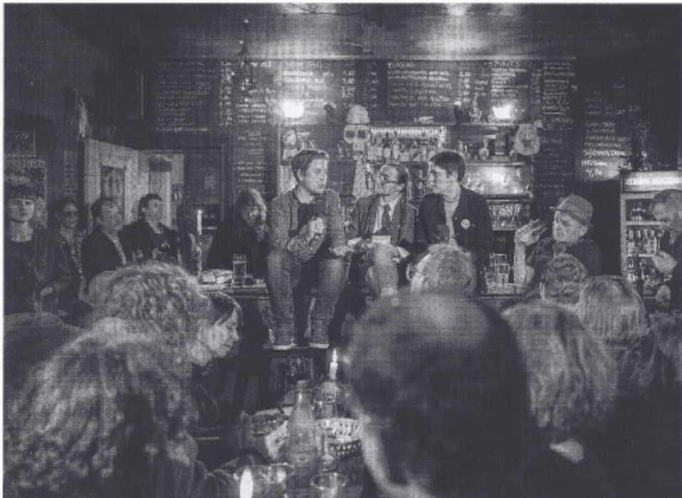
Juso Kühnert bei Kneipentalk: Ihm sind Kompromisse fremd