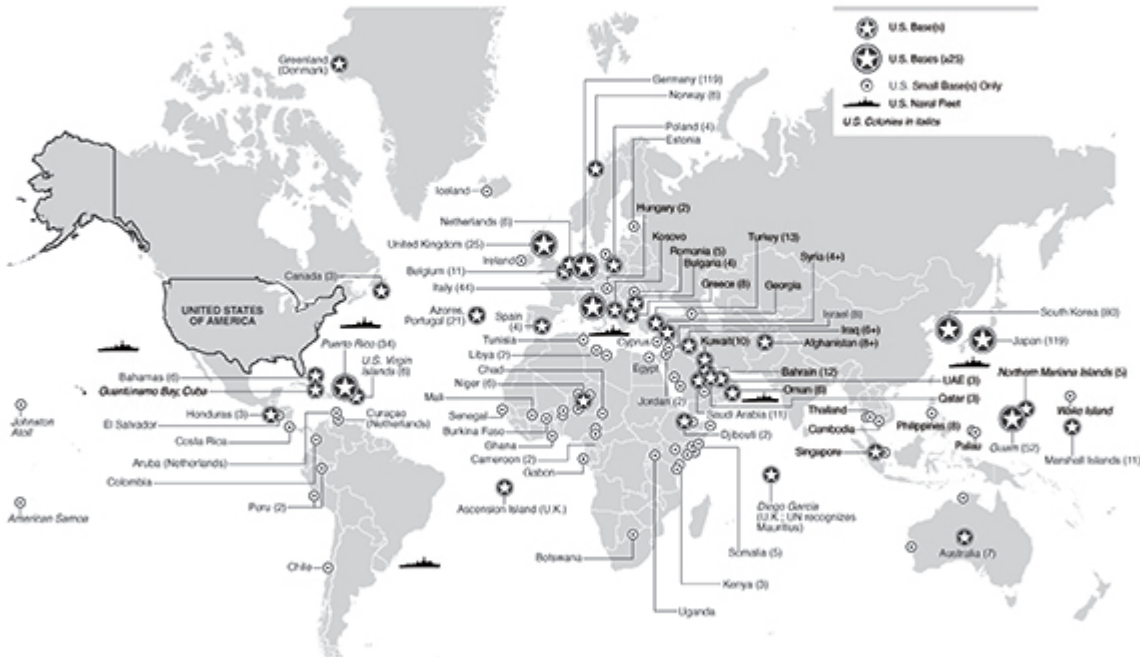
Map by Kelly Martin / kmartindesign.com for David Vine, The United States of War: A Global History of America's Endless Conflicts, from Columbus to the Islamic State (University of California Press, 2020).

In 2020, the United States controlled around 800 bases outside the 50 U.S. states and Washington, DC. Map reflects bases' relative number and positioning given best available data. For ease of comparison we use contemporary borders and a Mercator projection.