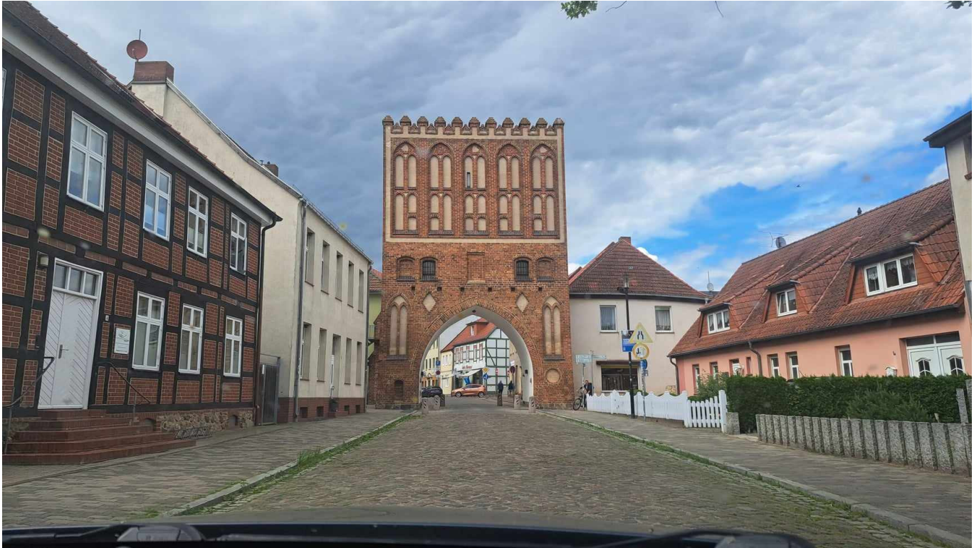
Malchin, Innenstadt

Lehmann bricht auf in Richtung des BSW-Büros in der Malchiner Innenstadt. Heute Abend findet dort eine Lesung statt. Vor dem Büro haben sich schon einige Interessenten eingefunden.