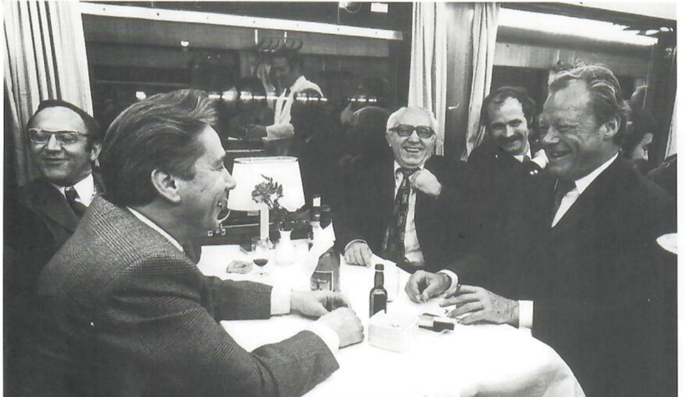
Willy Brandt im Gespräch mit dem russischen Journalisten Gregoriew im Wahlkampf-Sonderzug