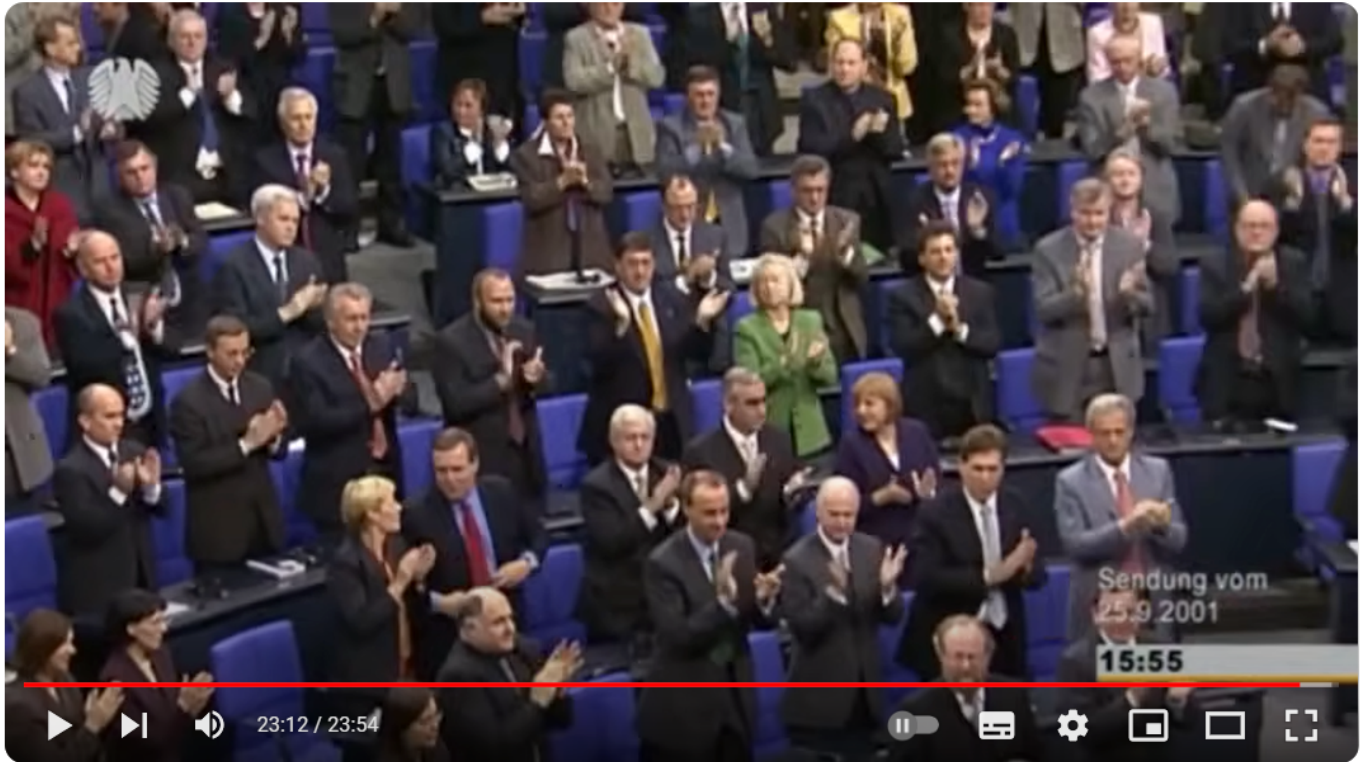
Wladimir Putin - Rede am 25. September 2001 vor dem Deutschen Bundestag (nur deutschsprachiger Teil)