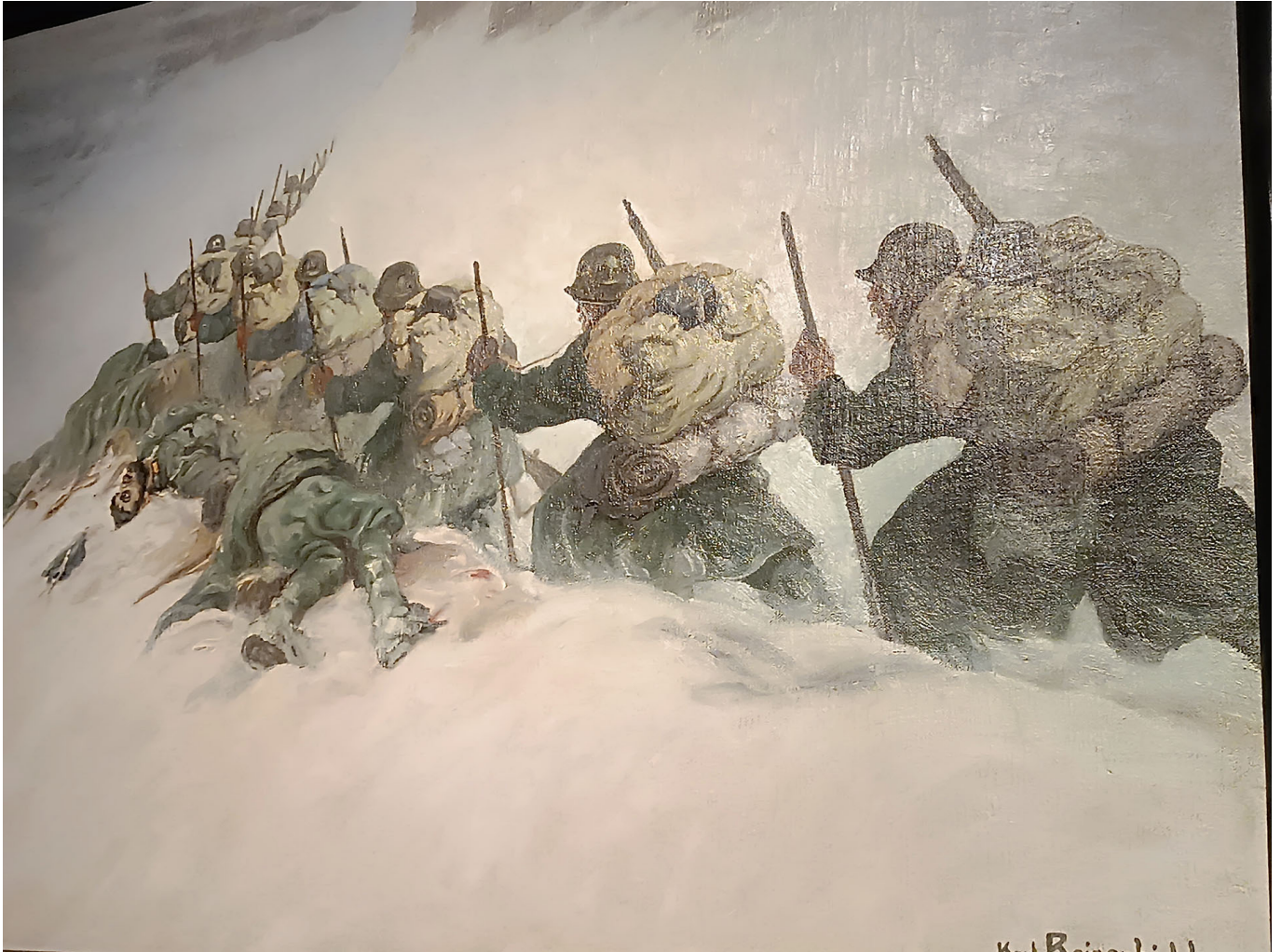
(Gemälde von Kriegern)