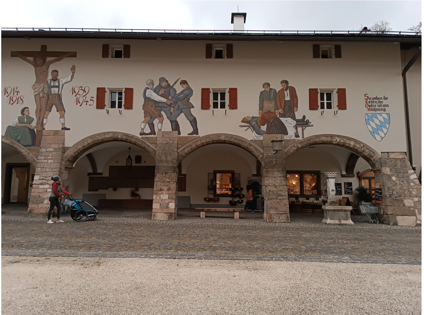
(Kriegerdenkmal in Berchtesgaden)

Von wegen romantische Idylle in Salzburg - Nachdenklich stimmende Eindrücke einer vergeblichen Reise raus aus dem gegenwärtigen Wahnsinn | Veröffentlicht am: 8. November 2023 | 6