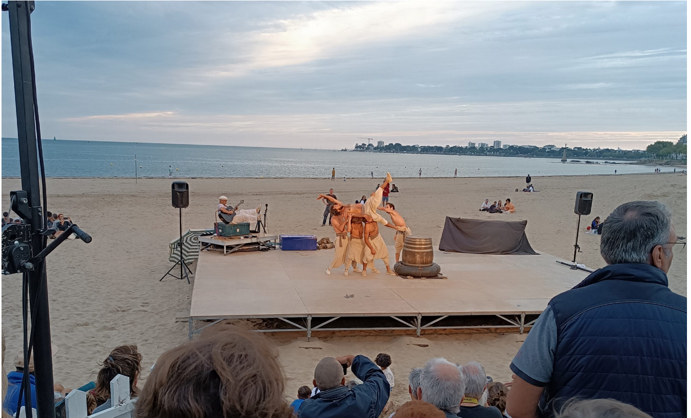
Theater am Hafen von Saint Nazaire