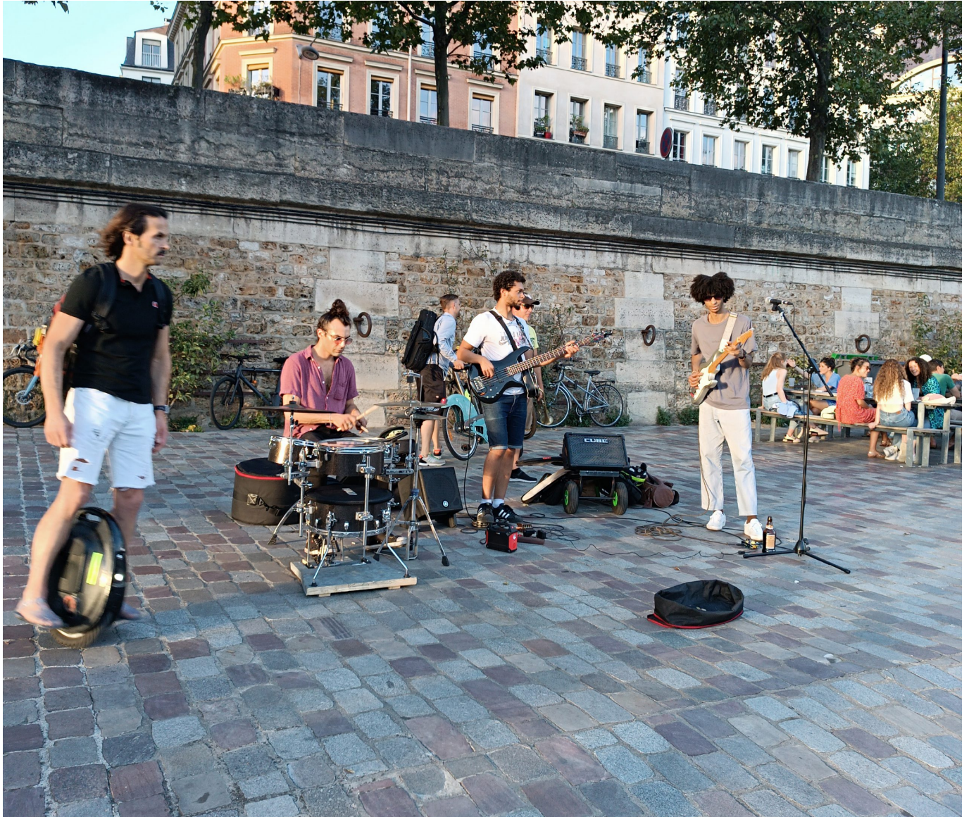
Wo man singt, da lass Dich nieder