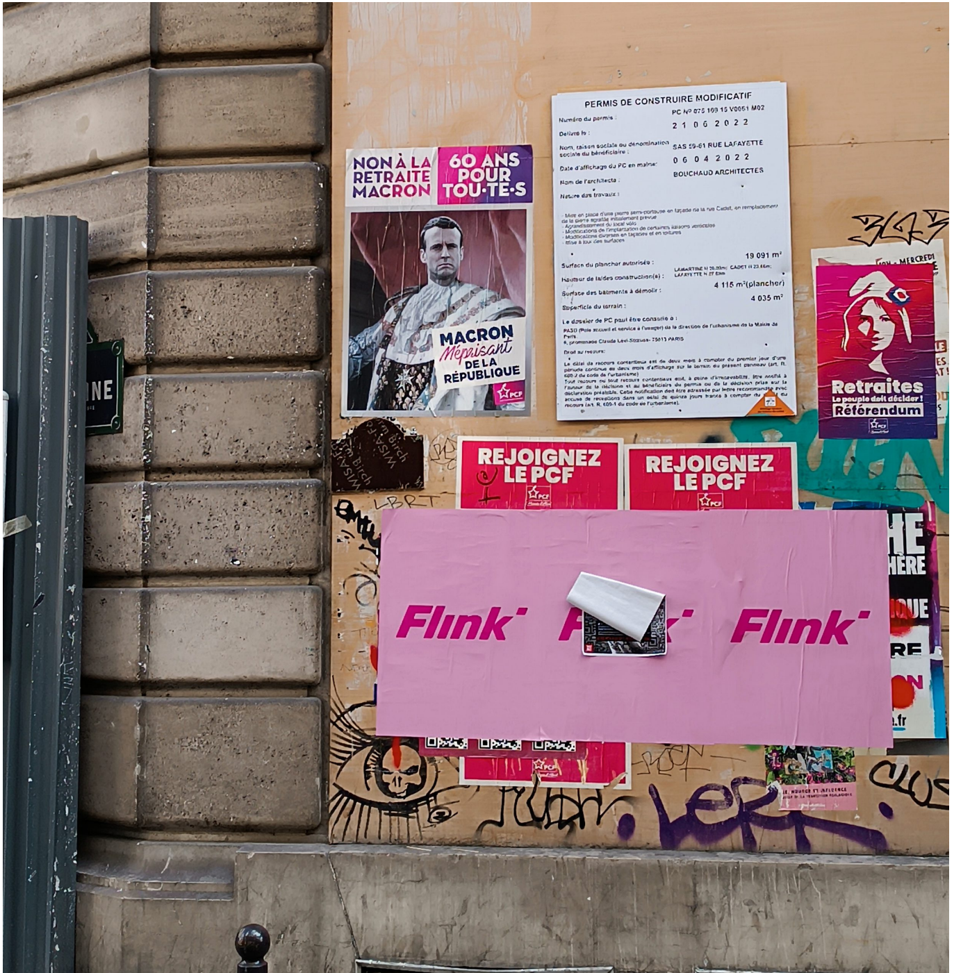
Plakate überall - Macron, Präsident der Reichen

Und 2024, Paris und Olympia? Ich frage Sebastian Chwala, was das wohl werden wird. Ich erlebte in Paris im August 2023 einen internationalen Sportwettbewerb, Radfahren in der City, und hatte kein gutes Gefühl - an zahlreichen Punkten standen Polizisten und Militär