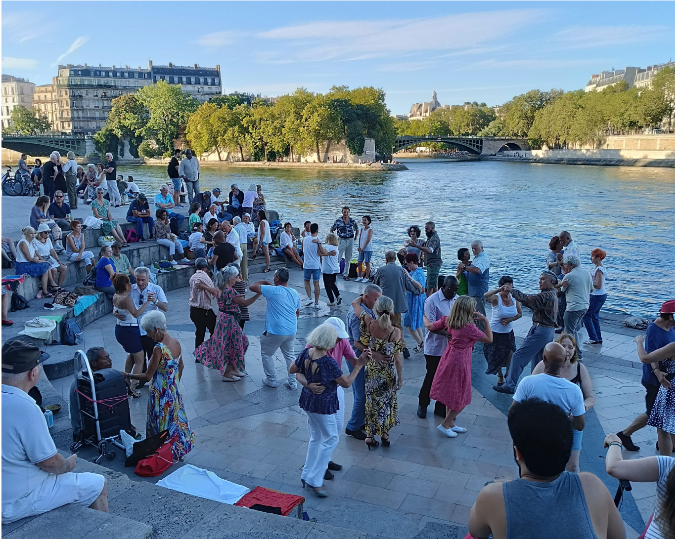
Die Menschen umarmen den Sommer, sie tanzen - Paris

Mitten in der Stadt findet wieder das Sommerfest „Strand Paris“ statt. Livemusik, Livemusik, Livemusik und andere Kulturformen inklusive. Kleine Bands spielen auf, Duos interpretieren Chansons. Ein alter Puppenspieler zieht an den Strippen einer kleinen Figur, die die Passanten begeistert. Es gibt Bier, 7, 8, 9 Euro kostet der Spaß. Die, die nicht so viel ausgeben wollen und können, haben alles halt auch so dabei, was den kulinarischen Rahmen für einen magischen Abend an der Pariser Seine perfekt macht.