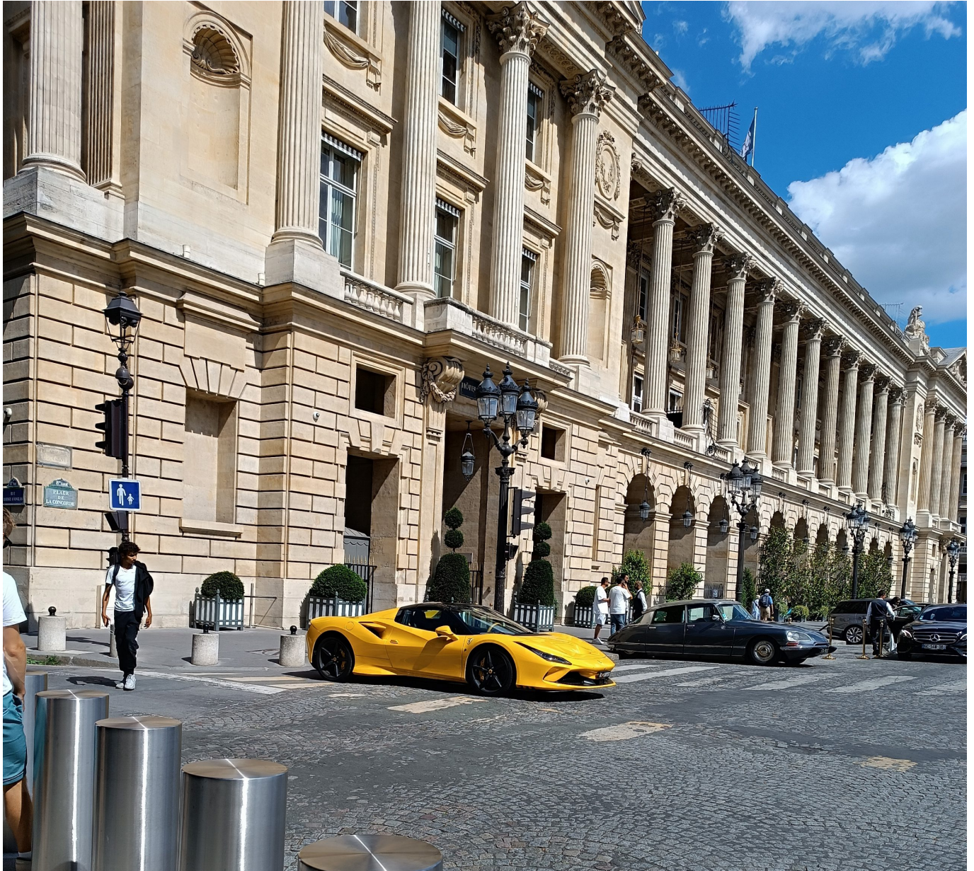
Luxushotels, Luxusautos – Paris 23 hat viel davon zu bieten