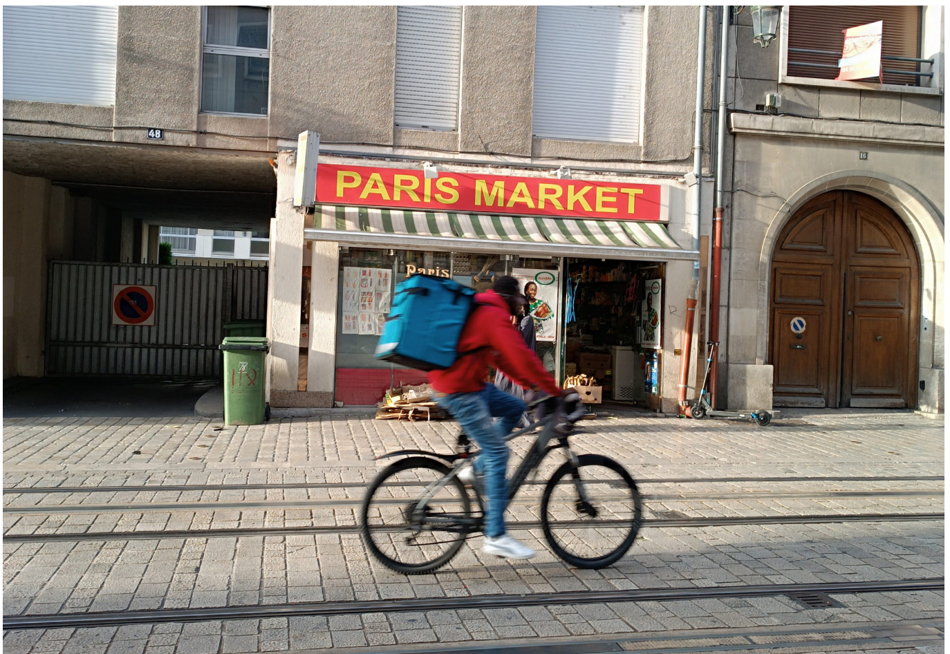
Überall Lieferservice - meist von schwarzen Bürgern geleistet

Organisationen und soziale Initiativen haben einen Aufruf gestartet. Darauf kam es in mehreren Dutzend französischen Städten zu Demonstrationen gegen die grassierende Polizeigewalt. Es wurden reale soziale Perspektiven für die Menschen in den französischen Banlieues gefordert“, so Sebastian Chwala, der besorgt ist, dass die Übergriffe der Polizei gegen Teile der Bevölkerung zunehmen, der Staat damit sozusagen fortwährend Stärke zeigt. Es ist Schwäche. In Sachen Wahlen berichtet er, dass Teilerneuerungswahlen der zweiten parlamentarischen Kammer, dem Senat, stattfanden. 78.000 sogenannte große Wähler, davon 95 Prozent Kommunalpolitiker, waren dazu aufgerufen. Sebastian Chwala kommentiert: „Die traditionell erdrückende Mehrheit der Rechten wurde bestätigt. Die dominierenden Republikaner gewannen 143 Sitze. Großer Verlierer war die Macron-Partei „Renaissance“, die von 23 auf 16 Sitze schrumpfte. Andere liberale Parteien gewannen Mandate hinzu.