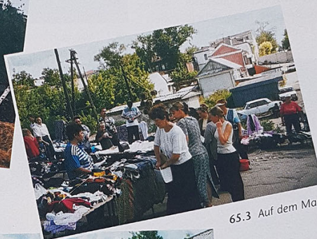
65.3 Auf dem Markt